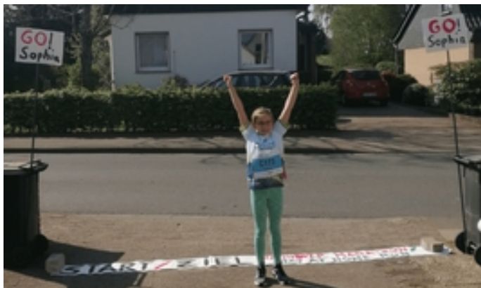
Die offizielle Start und Ziel-Line.